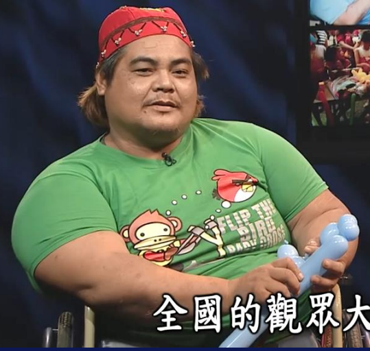
全國的觀眾大家好