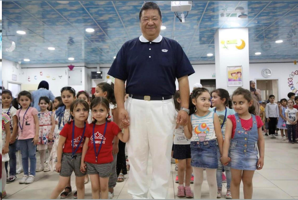
不請之師-愛在滿納海 3'40''