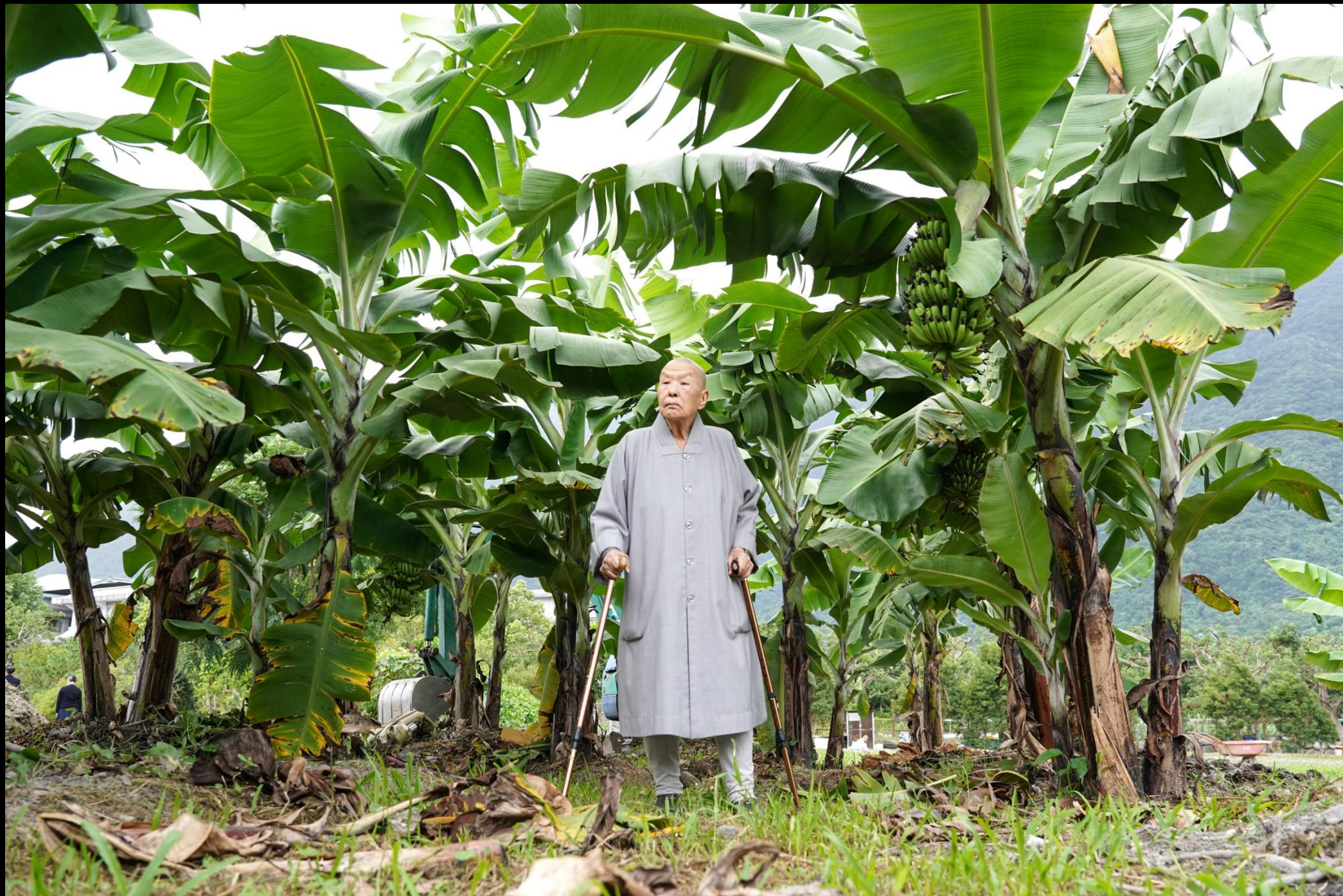
德昭師父巡田 攝於八十六歲