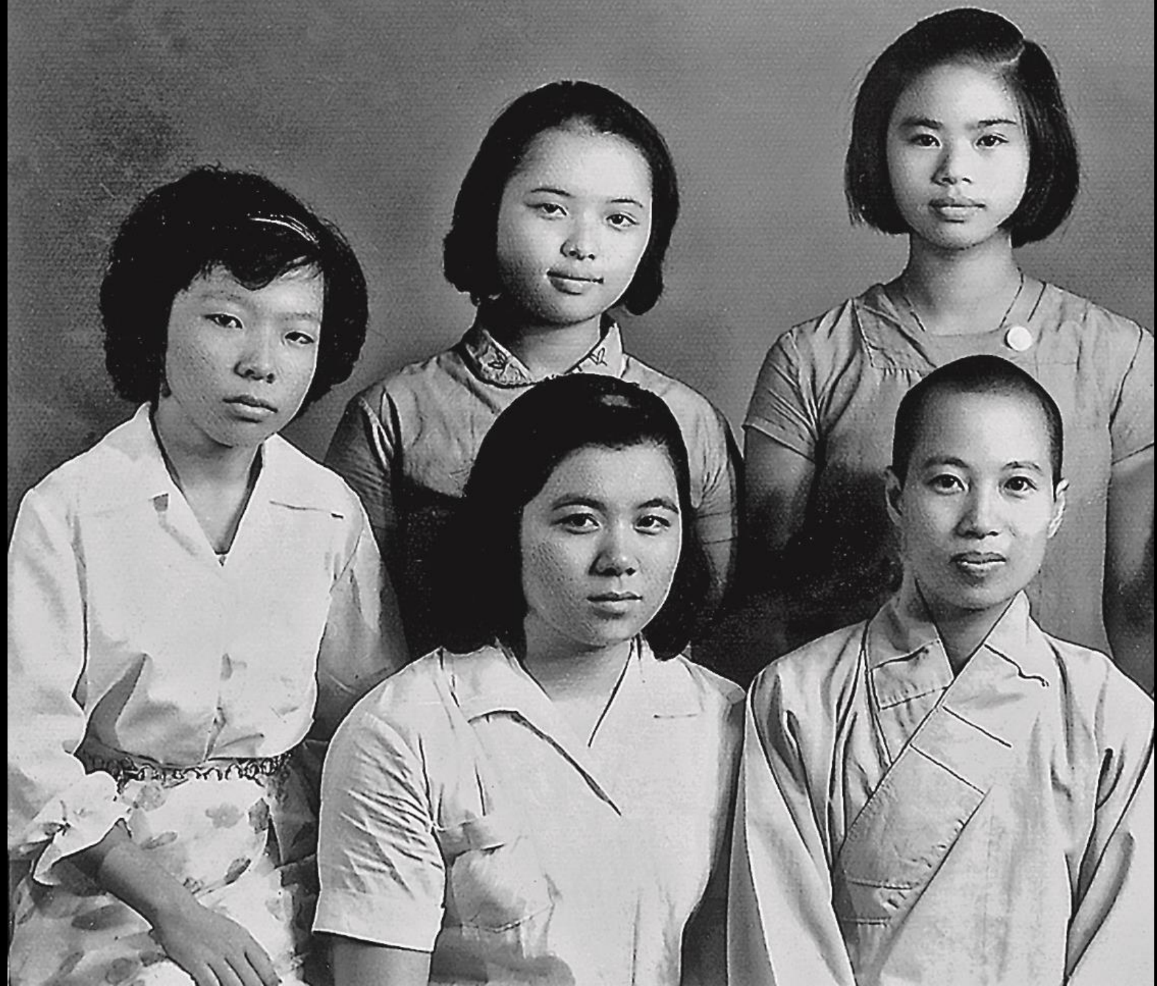
在慈善寺皈依的五位弟子