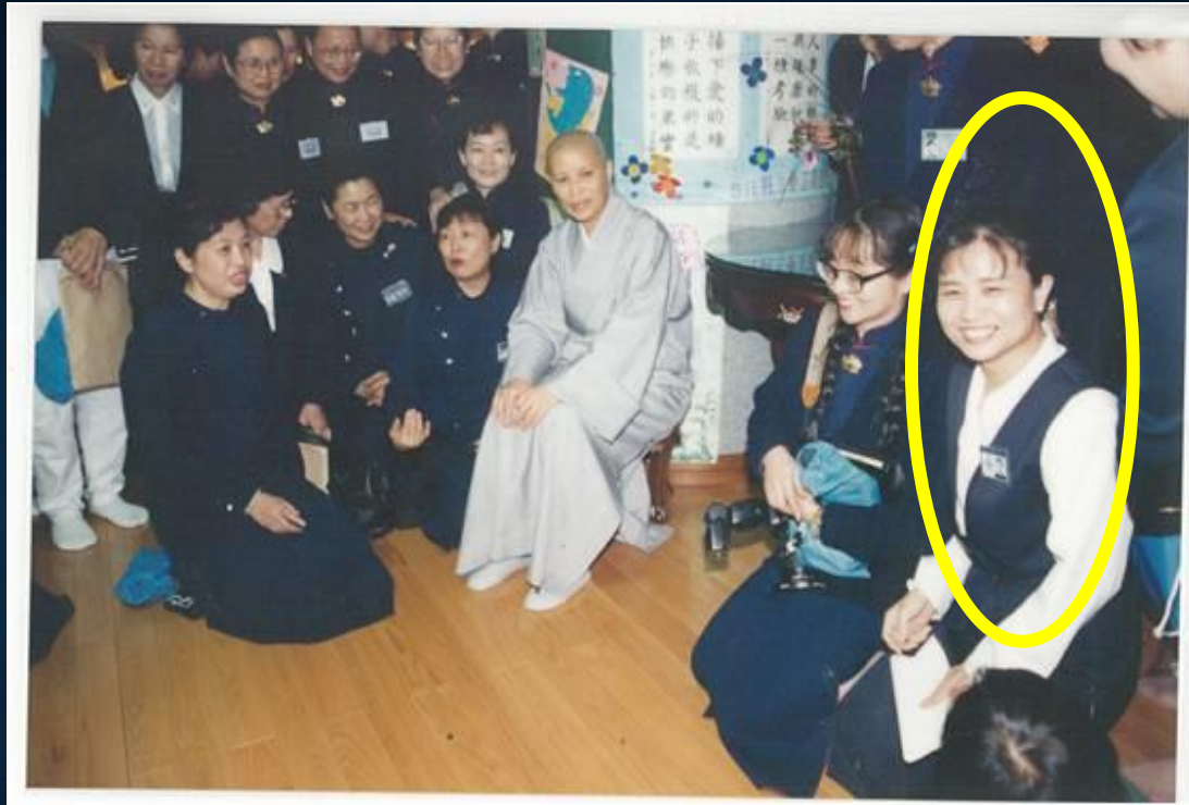
1996年，慈濟30周年，臺北分會 活動組執行祕書 法喜？