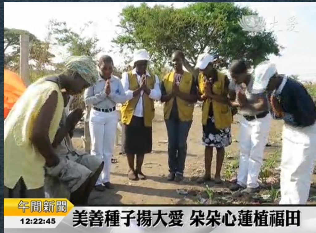
午間新聞 12:22:45 美善種子揚大愛 朵朵心蓮植福田