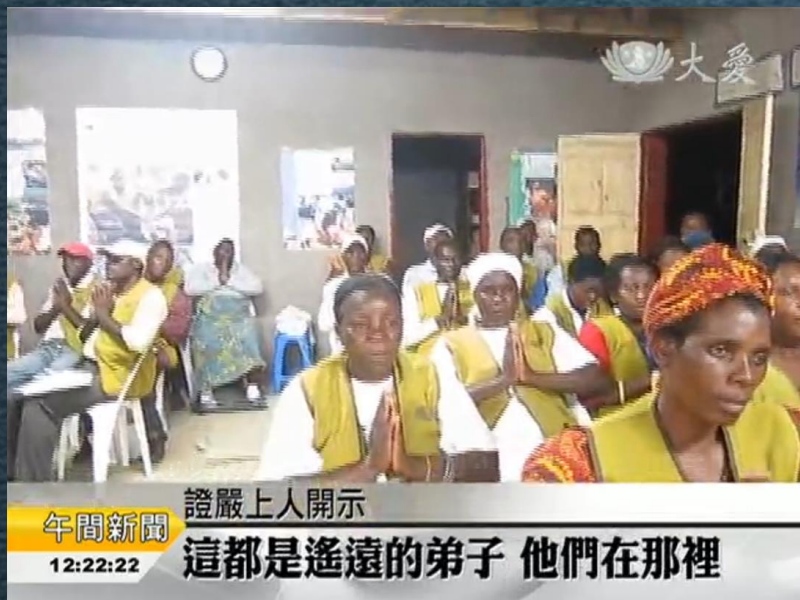
午間新聞 12:22:22 證嚴上人開示 這都是遙遠的弟子 他們在那裡