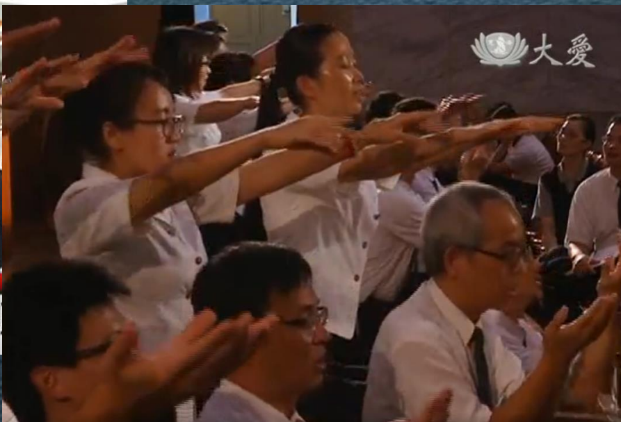
跨校演出不畏難 通訊軟體