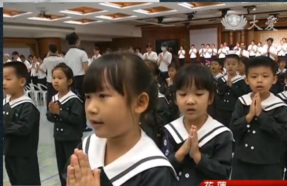
教育志業25周年 經藏演繹同歡慶