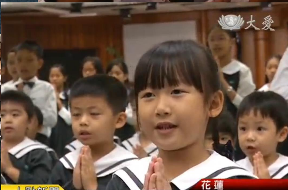
小小娃兒大聲唱 菩提種子善萌芽