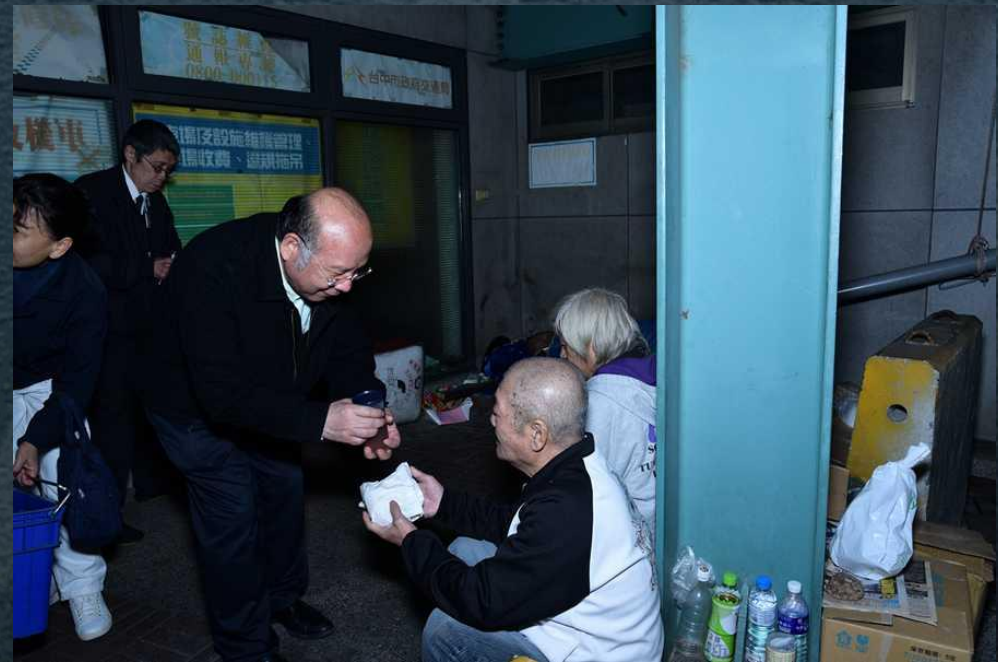
台中慈院醫師寒冬街頭送暖