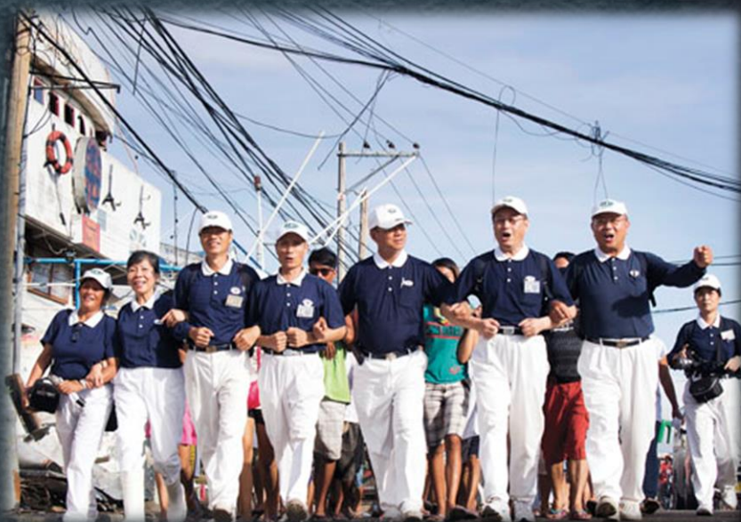
22:1 海燕橫掃菲律賓 以工代賑幫助站起