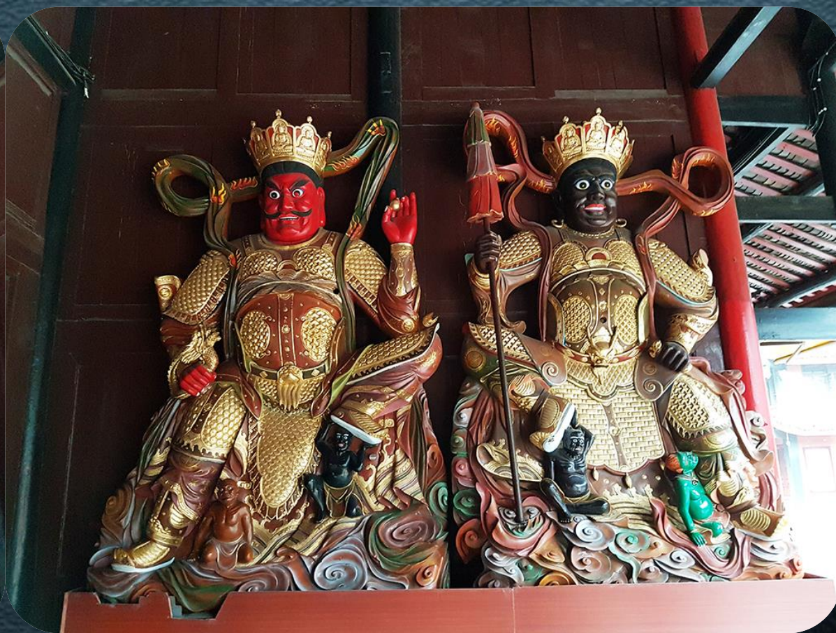
東方持國天王 南方增長天王 西方廣目天王 北方多聞天王 須彌山黃金埵 須彌山琉璃埵 須彌山白銀埵 須彌山水晶埵