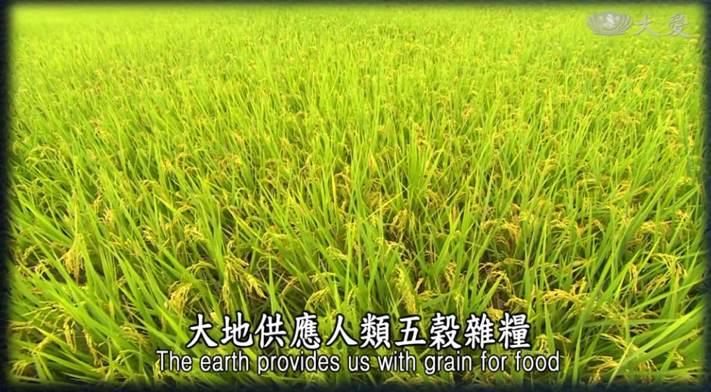
大地供應人類五穀雜糧 The earth provides us with grain for food