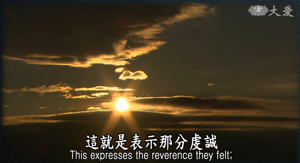
這就是表示那分虔誠 This expresses the reverence they felt;

梵天王尋光推尋， 必有非常之因， 推論必是佛出世， 光的源頭雖過千 萬土，不離當處