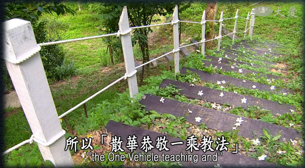
所以「散華恭敬一乘教法」 "the One Vehicle teaching and"