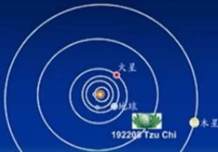
慈濟小行星軌道圖