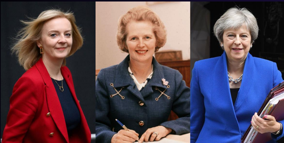
英國政壇史上3位女首相！ 特拉斯、柴契爾夫人、梅伊