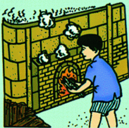
4 · 烧结