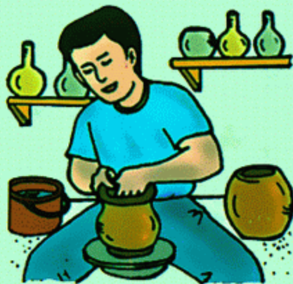
2 · 成型