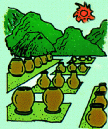
3 · 干燥