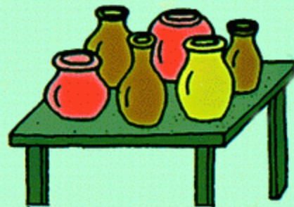
6 · 陶器