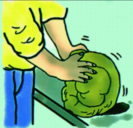
1 · 混合