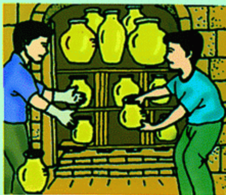
5 · 冷却