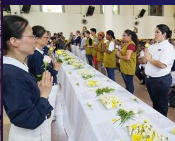
2017年 慈濟全球 首場浴佛 典禮是在 厄瓜多爾 聖塔安娜 教堂舉行。