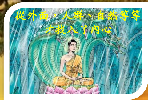
從外面，人群、自然等等 才找入了內心

在這安靜中，二十一日，他突然間開悟了，那個身、心、靈，整個安靜下來之後，一定是外面的境界都清楚，找進來心靈的境界，寂靜清澄，心完全沒有波動。