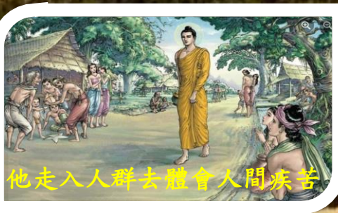
他走入人群去體會人間疾苦