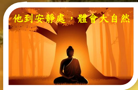
他到安靜處，體會大自然