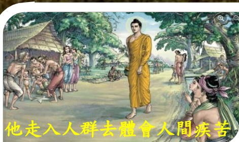
他走入人群去體會人間疾苦